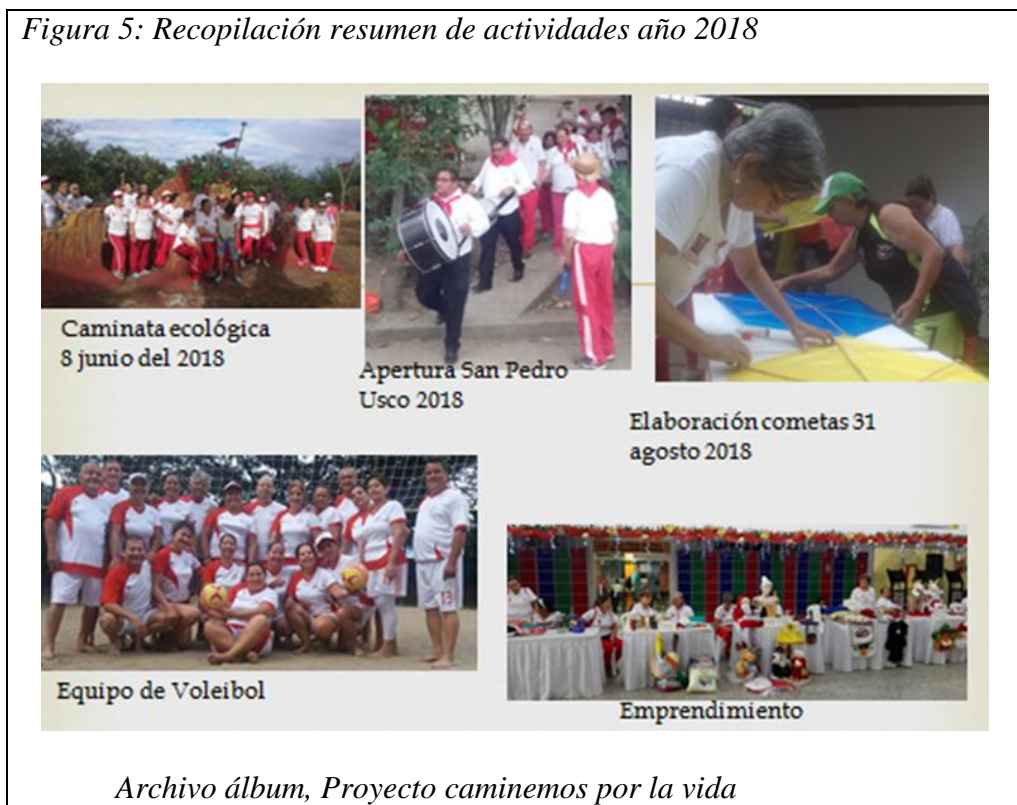
Figura 5: Recopilación resumen de actividades año 2018

Dentro de la organización han surgido talentos deportivos, culturales y de emprendimiento. Muchos de los adultos mayores que nunca en su vida habían realizado una actividad fuera de su cotidianidad, tuvieron la oportunidad de experimentarla dentro del proyecto, encontrando habilidades que no sabían que tenían, o que disfrutaban de aquella actividad, logrando reconocimiento en otros escenarios, como también el compartir de sus conocimientos y experiencias respecto a un arte culinario, manual u otro ( multiculturalismo ).