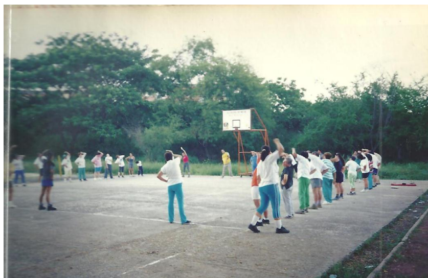
Archivo álbum, Proyecto caminemos por la vida