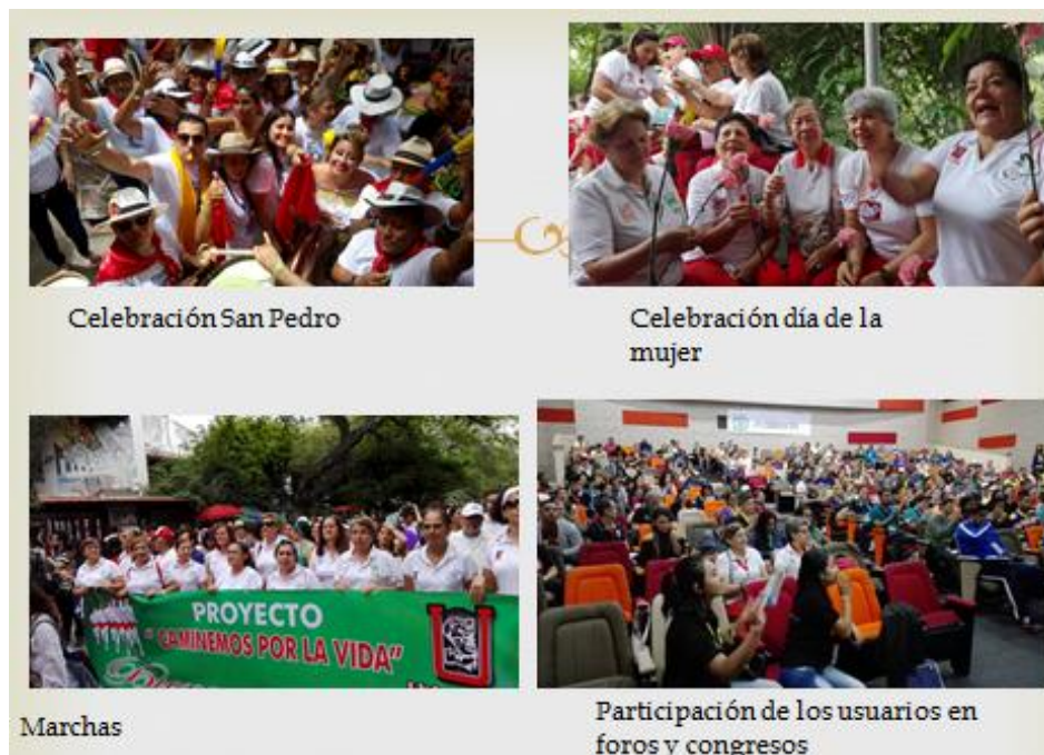
Archivo álbum, Proyecto caminemos por la vida

La Universidad Surcolombiana, no solo ha abierto las puertas para que los adultos mayores y demás usuarios del proyecto se reúnan en las instalaciones de la misma, sino también ha brindado el apoyo a través de la facultad de educación con los programas de Educación física y educación artística y la facultad de salud con el programa de enfermería, para el aprestamiento de las prácticas de los estudiantes en el proyecto “Caminemos por la Vida”. Esta inclusión social que viven los adultos mayores, genera en ellos esperanzas de un mañana con propósito ( expectativa del futuro ), en donde no solo se dedican a envejecer, sino también a saber envejecer, porque consideran que servir al prójimo debe ser parte esencial de proyecto tanto como los mismos ejercicios ( solidaridad social ).