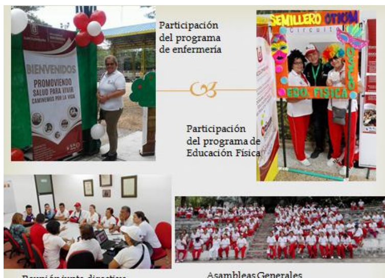
Archivo álbum, Proyecto caminemos por la vida

El papel de la junta directiva con el apoyo de los programas de enfermería y Educación física, han facilitado la orientación de los cronogramas de las actividades contempladas mes a mes para los usuarios del proyecto. Esto ha especificado un orden claro y preciso para evitar desarticulaciones informativas y extracurriculares que en ocasiones pueden afectar la seguridad y convivencia de los usuarios. La práctica