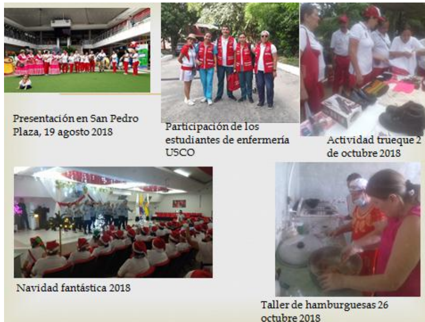
Figura 6: Recopilación de actividades año 2018