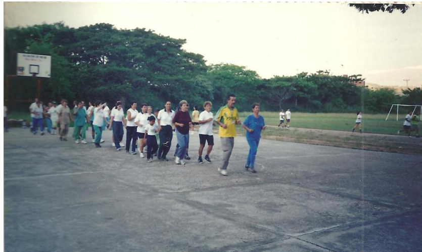
Archivo álbum, Proyecto caminemos por la vida