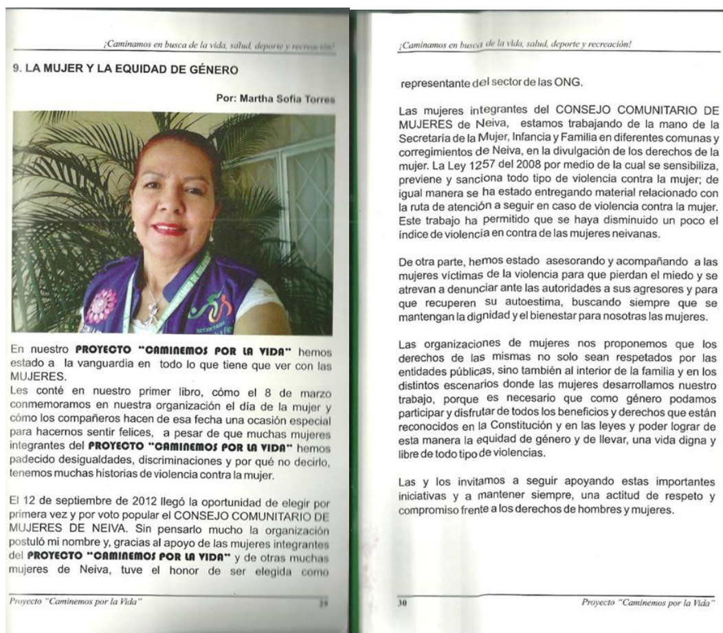
Fragmento de la página 29 y 30 del Proyecto Caminemos Por la Vida, memorias

La participación de las mujeres en otros escenarios a parte del voto popular, han generado interés en los medios comunicativos, como son las ferias del emprendimiento.